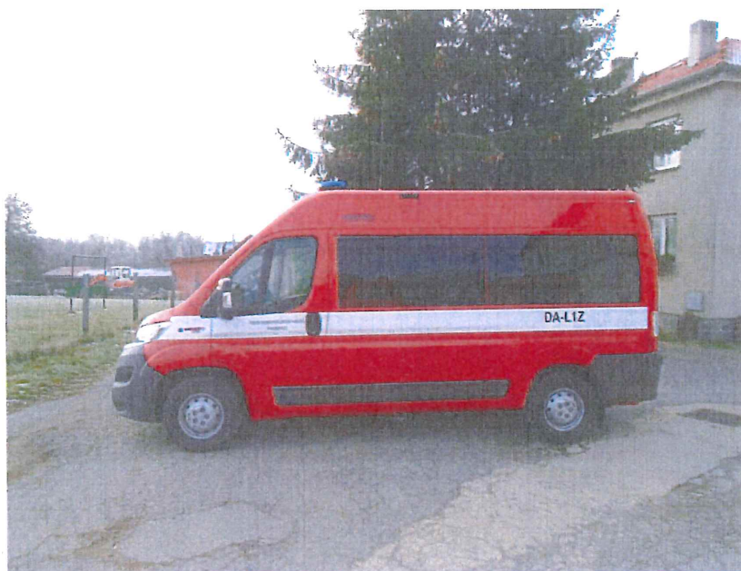
Obrázek 1 - Ilustrační foto

Nabídku vypracoval: Radek Smrž - pobočka Brno e-mail: rsmrz@agrotec.cz tel.: 602 278 629