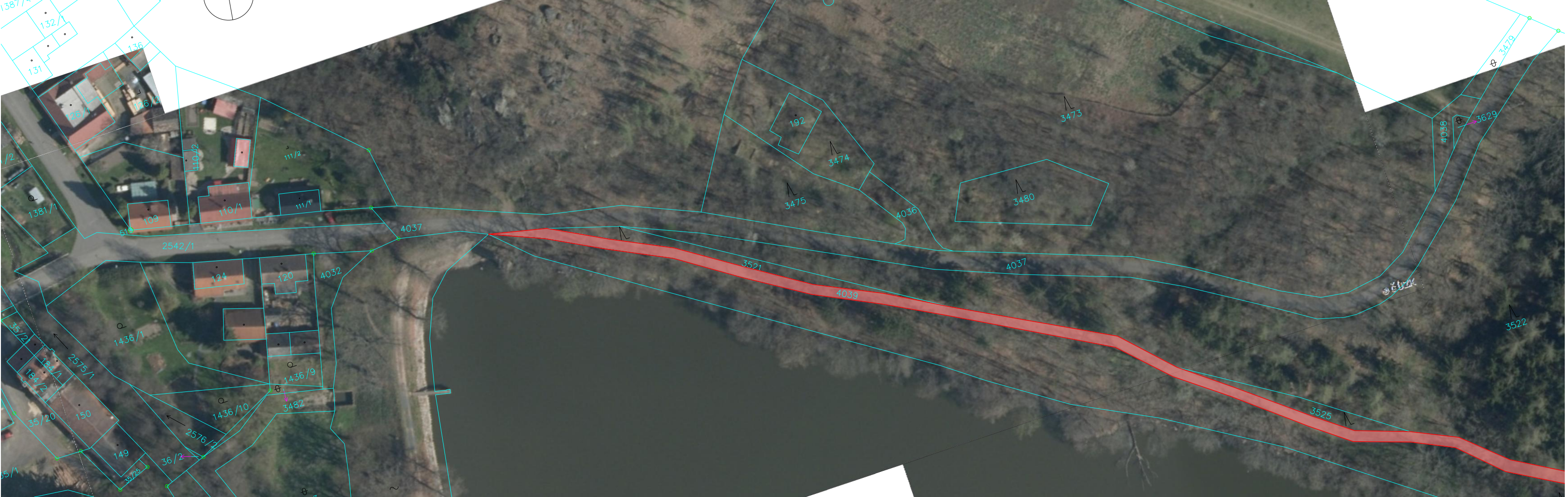
SITUACE - ČÁST 3